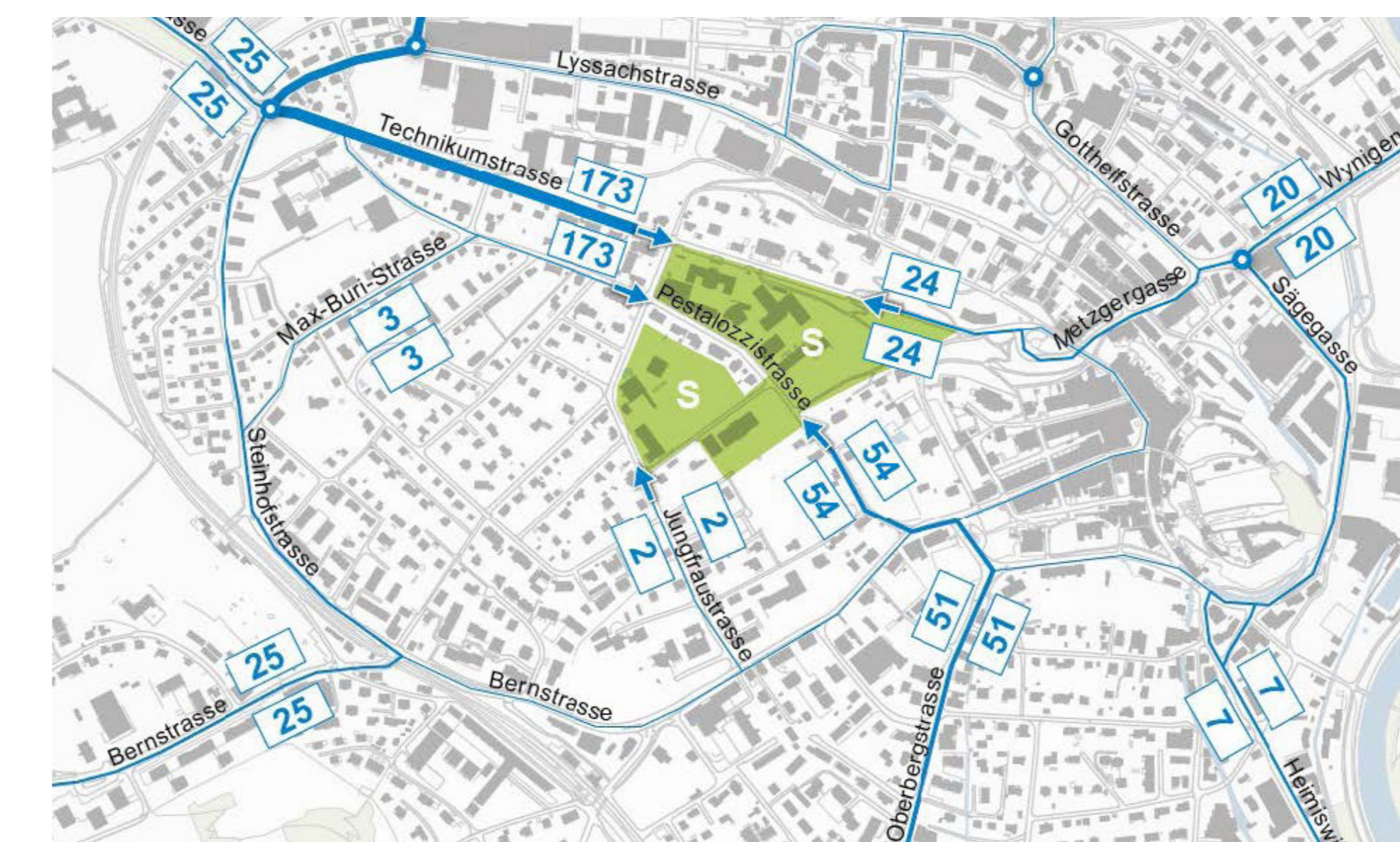
Der motorisierte Verkehr heute.

In den Werkhallen verarbeiten die Lernenden im Rahmen ihrer Ausbildung diverse Materialien. Dadurch steigt der Last- und Lieferwagenverkehr von heute 10 auf künftig 46 Fahrten – für beide Schulen. Die Anlieferung für die TF Bern erfolgt unterirdisch in der Einstellhalle. Deren Eingang liegt im östlichen Bereich der Technikumstrasse.