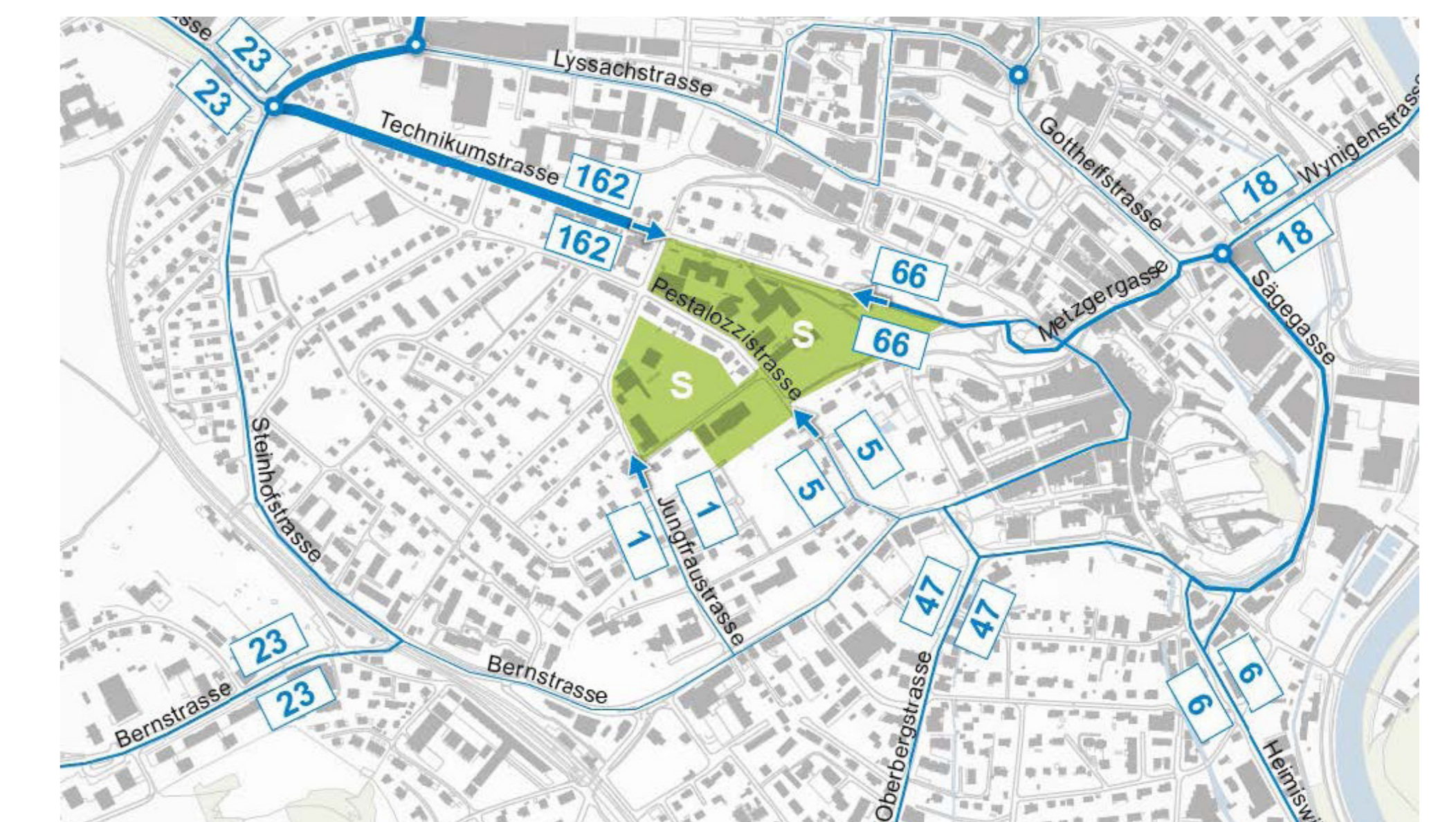
Der motorisierte Verkehr künftig (Prognose): mehr Verkehr via Metzgergasse, dafür Entlastung der Technikumstrasse West und Pestalozzistrasse.