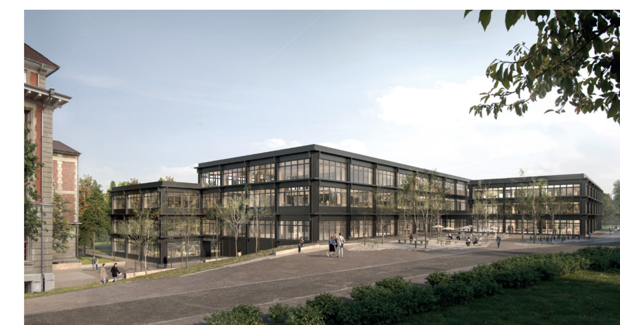
Der dreistufige Neubau für die Technische Fachschule Bern.