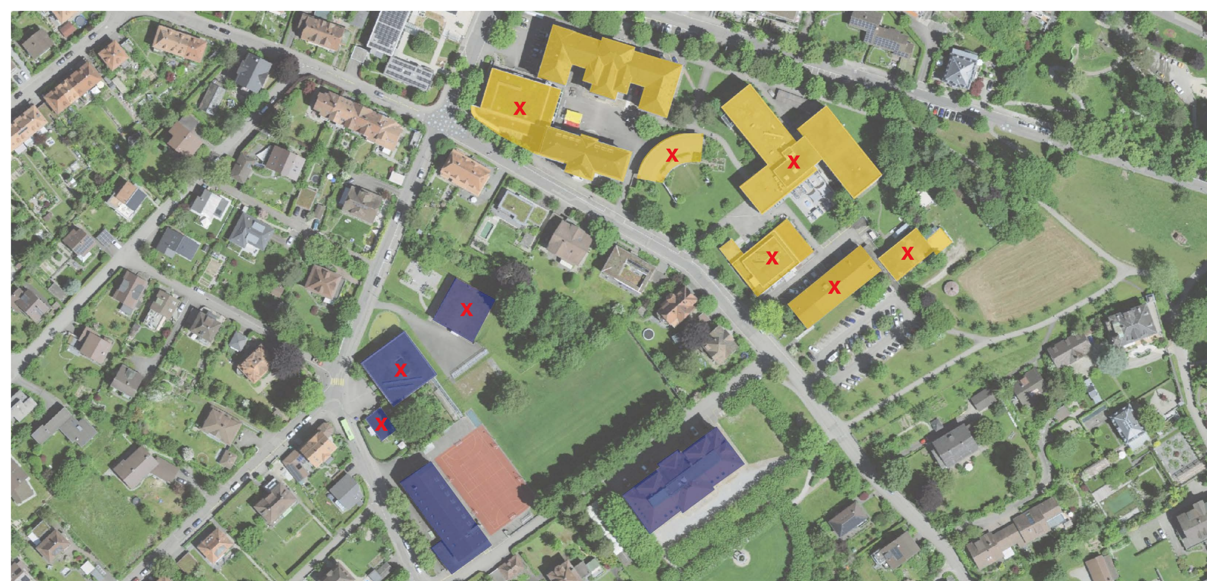
So sieht das Ensemble mit dem Gymnasium Burgdorf (blau eingefärbte Gebäude) und der BFH (gelb) heute aus. Auf beiden Arealen bleiben jeweils zwei historische Gebäude bestehen. Die restlichen Gebäude werden abgebrochen und machen den Neubauten Platz.

Erst nach dem Wegzug der BFH nach Biel – voraussichtlich 2027 – kann auf dem Gsteig mit dem Neubau der TF Bern begonnen werden. Die Voraussetzungen dafür sind nun geschaffen. Rechtliche Hürden, die den Bau des Campus in Biel bisher verzögerten, sind beseitigt. Der Bau der TF Bern könnte gemäss heutigem Planungsstand 2028 beginnen und 2031 abgeschlossen sein.