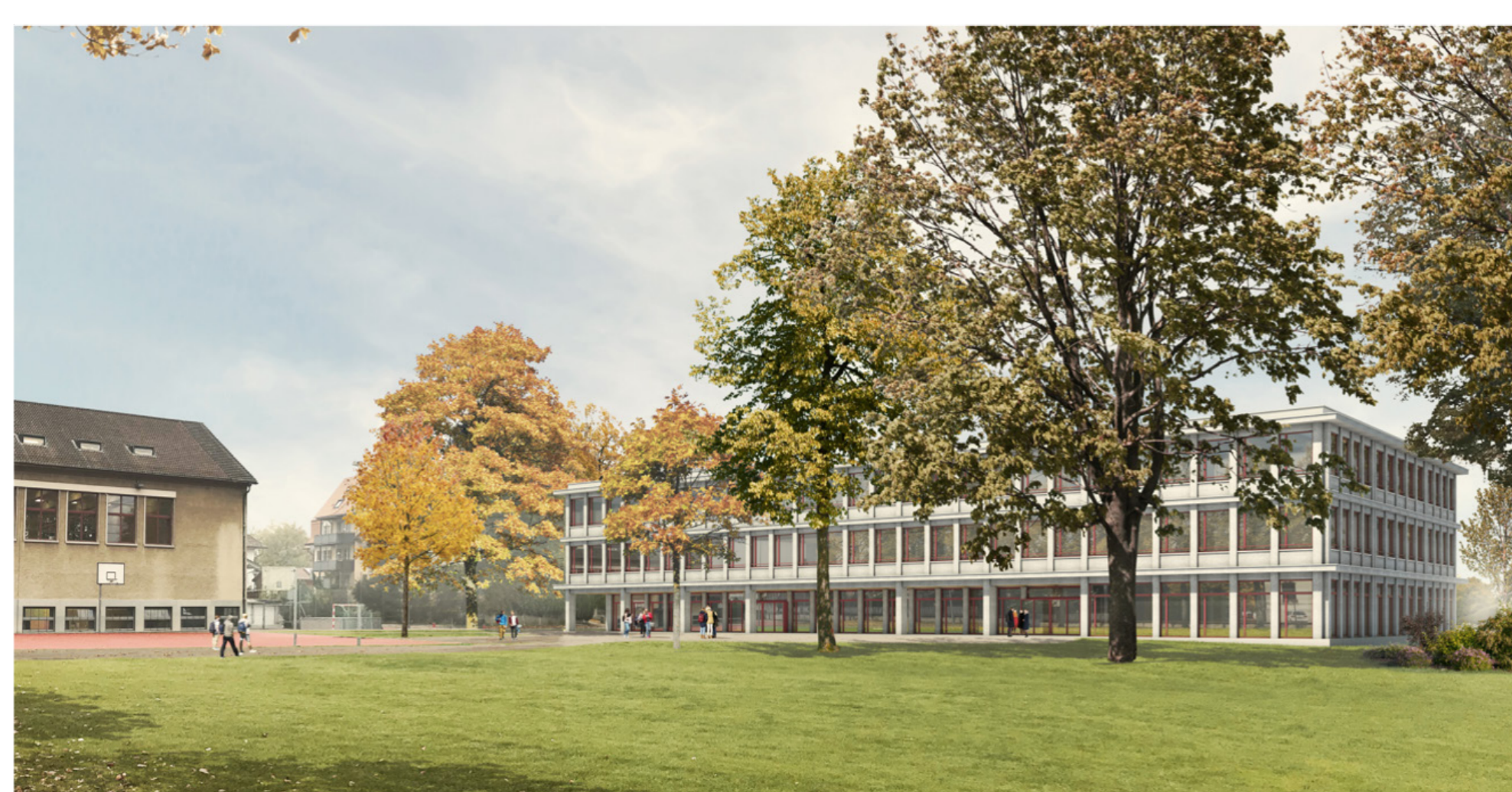
Der Neubau für das Gymnasium Burgdorf.

Der Kanton Bern gestaltet das Gsteig-Areal neu und siedelt die Technische Fachschule Bern (TF Bern) an. Sie gründet mit dem Gymnasium den Bildungscampus Burgdorf. Beide Projekte werden unabhängig voneinander realisiert. Die gemeinsame Nutzung von Aula, Mensa und Sportanlagen schafft Synergien und Raum für Austausch.